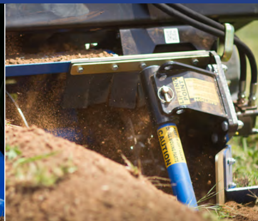
Tanah sisa galian ditumpuk rapi di samping lubang parit