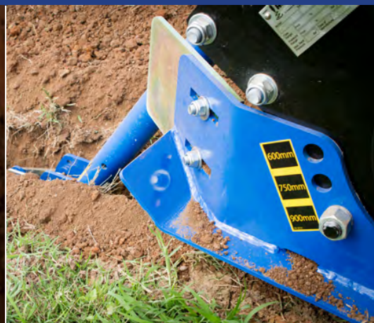
Plat kontrol kedalaman yang presisi memberikan opsi hingga 3 tingkat kedalaman lubang parit yang berbeda.